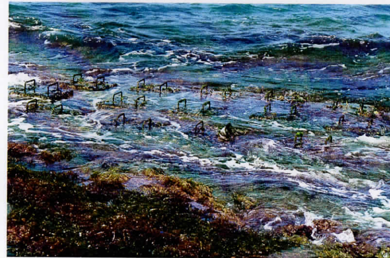
設置された鉄スラッジ固体（2011年2月5日）