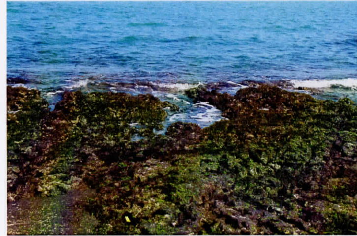
2011年2月5日の当添・採集地