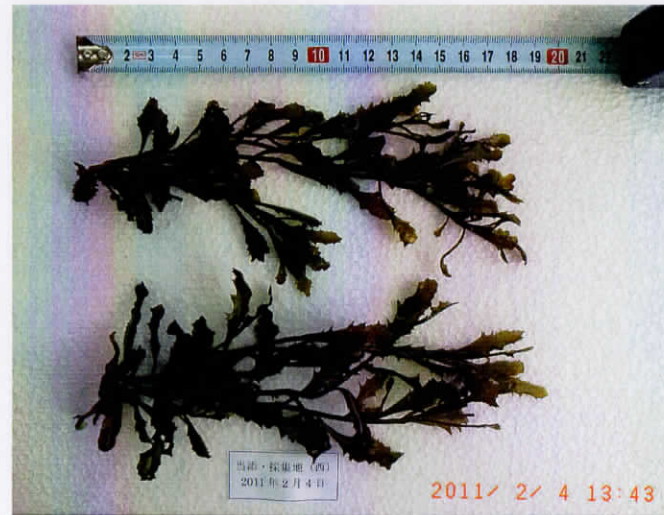
当添・採集地のヒジキ (19cm)