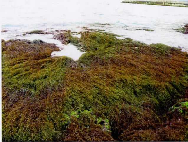
2010年2月3日の当添・採集地