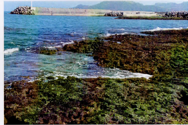
2011年2月5日の当添・採集地