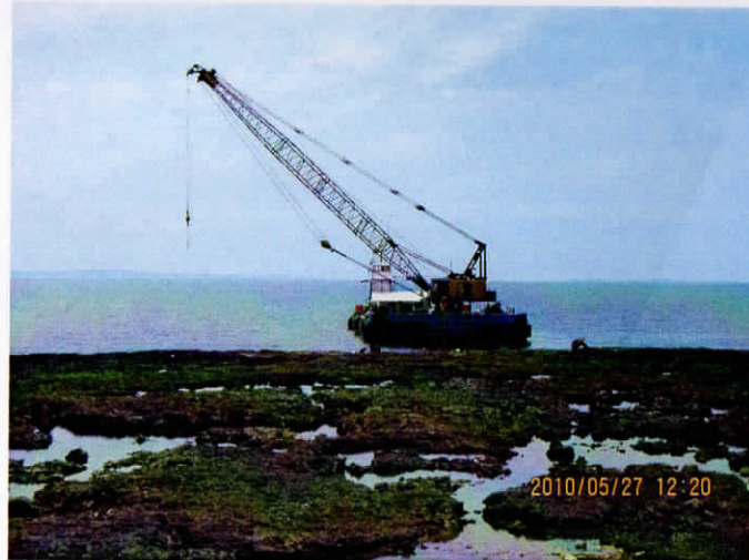
鉄スラッジ設置風景（2010年5月27日）