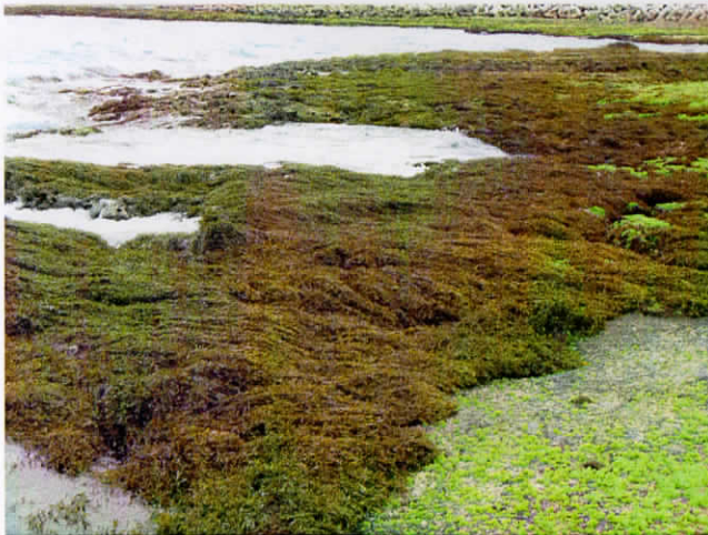
2010年2月3日の当添・採集地