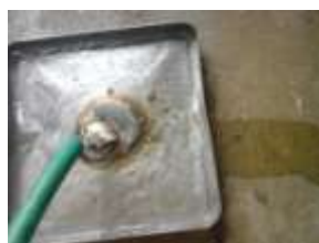
水で表面の殻を落とします