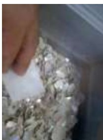
粘着面に夜光貝の薄膜を吸着