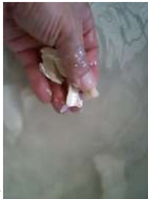
水に浸しながら指でこす