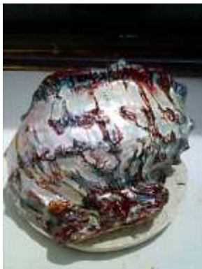
注文品 家のお守り床の間用