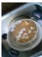
洗浄の準備、大鍋に煮込み鍋をセット