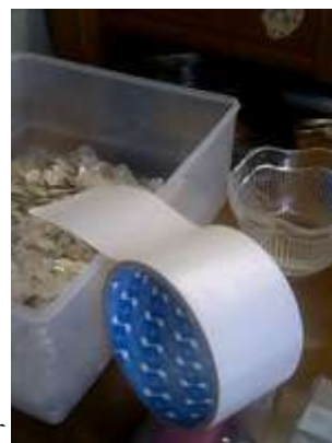
両面テープを準備します