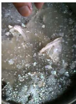
水を浸した鍋で煮込みの準備