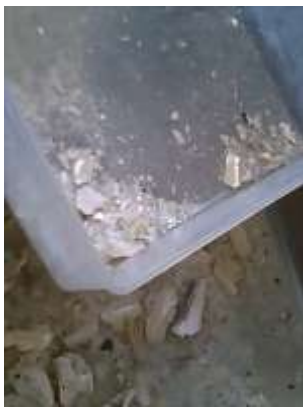
水切りして乾燥させます