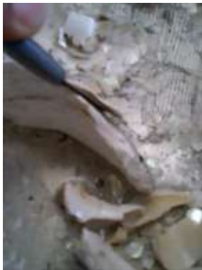
カッターではがす