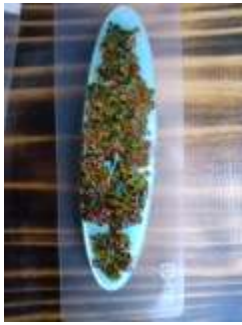
ブルーに3原色基調