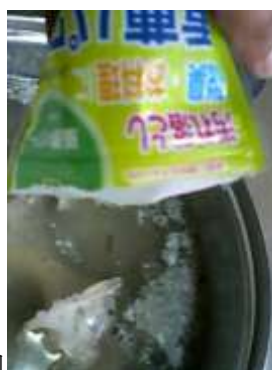
重層を大サジ1杯添加