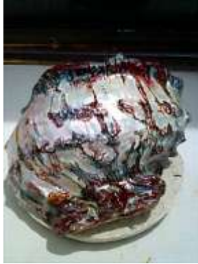
注文品 家のお守り床の間用