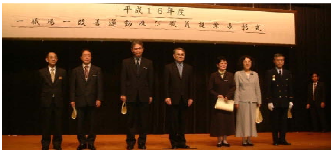
(写真・上) 知事と一職場一改善運動受賞者

改善運動については、継続して取り組むようにお願いします。受賞提案については、今後、具体的な実施に向けて関係課と調整を進めていきます。