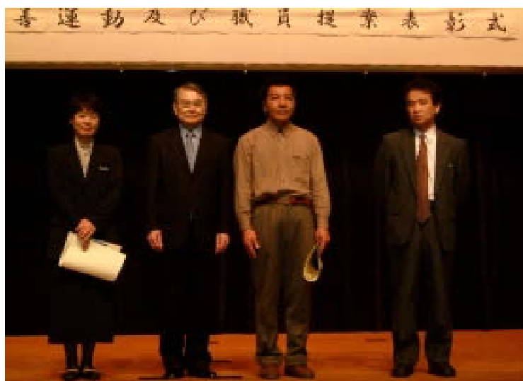
(写真・左) 知事と職員提案受賞者